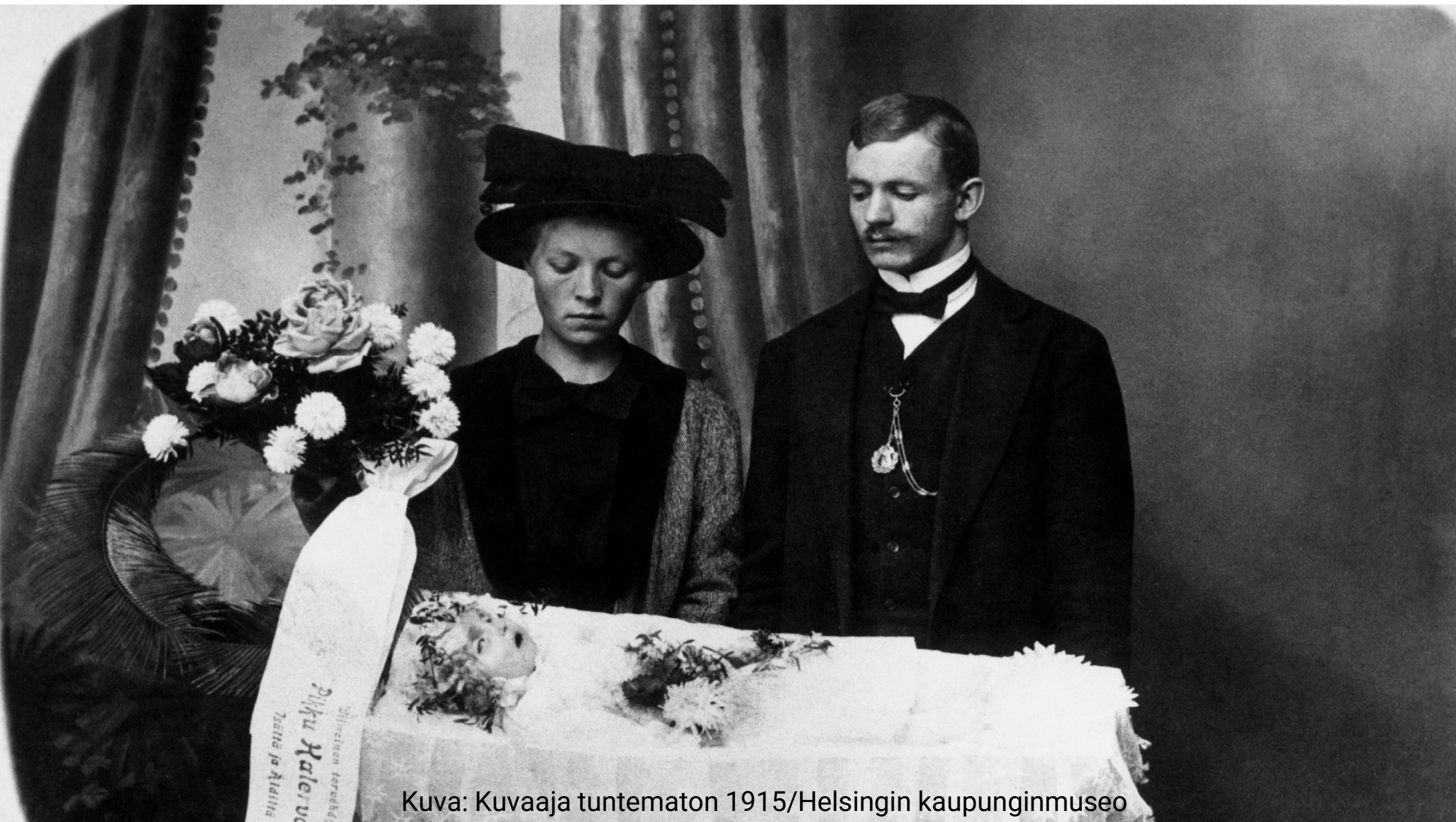
Kuva: Kuvaaja tuntematon 1915/Helsingin kaupunginmuseo